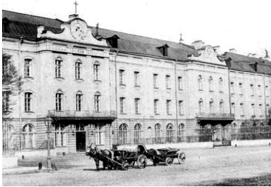
Императорский Санкт-Петербургский университет на рубеже XIX–XX веков