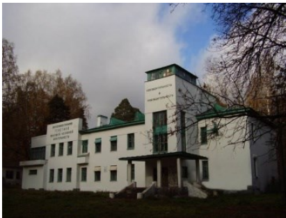
Биостанция Физиологического института в Колтушах: довоенные годы и современный вид