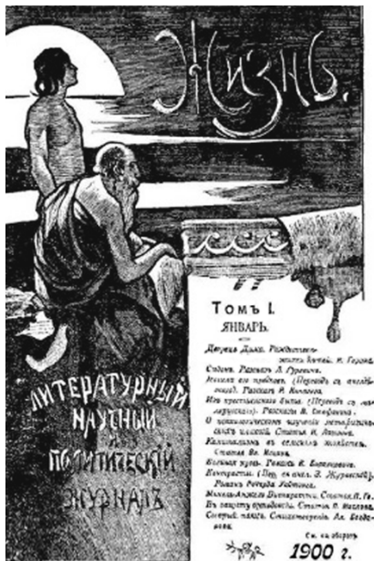
Обложка журнала «Жизнь»