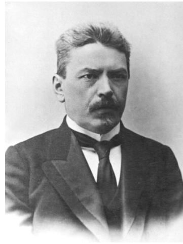
Сергей Иннокентьевич Поварнин

событий. В 1917 г. ему было 37 лет, он достиг творческой зрелости, своего акме, уже успел реализовать многие свои начинания. Получивший добротное образование, постоянно подкреплявшееся самообразованием, знавший древние и основные европейские языки, С. И. Поварнин, тем не менее, всегда ощущал себя плотью от плоти своего народа; в политике он не участвовал, но всецело принадлежал своему поколению, искавшему истину, надеющемуся на воплощение грандиозных общественных идей и смелых собственных замыслов с нескончаемой верой «в силы нашего народа и в силы новых поколений». Цитата, вынесенная в заголовок статьи, взята из «Новогодних упований» С. И. Поварнина — публицистического очерка, написанного в преддверии наступающего XX века. Этими словами Поварнин охарактеризовал основное стремление своего поколения — своих современников, молодость которых пришлось на конец XIX века.