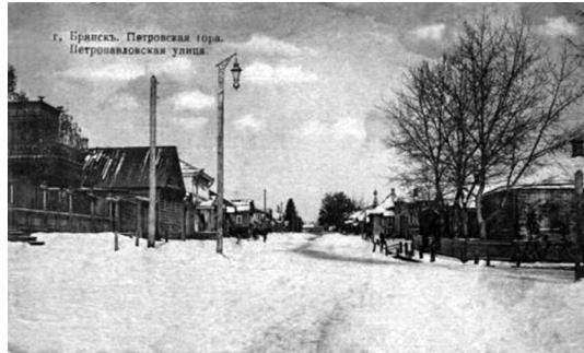
Брянск, Петро-Павловская улица